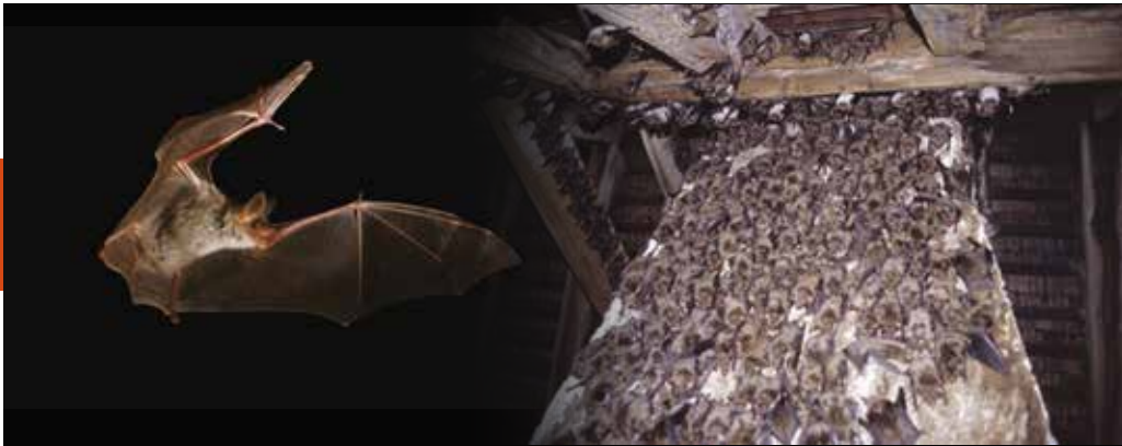
Grand Murin en vol