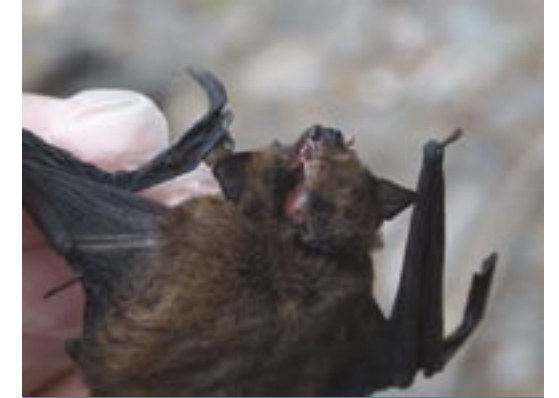
Pipistrelle commune ( Pipistrellus pipistrellus ) avec le crâne fracturé, retrouvée morte sous une éolienne (Allemagne). Même des espèces connues pour voler à faible hauteur sont victimes des éoliennes.

Exception faite des périodes crépusculaires (soir et matin) où les chauves-souris peuvent être vues, l'étude du comportement des Chiroptères repose sur des technologies onéreuses telles que des caméras infrarouges, soit à images thermiques, soit avec un puissant illuminateur infrarouge. Compte tenu de son prix, l'utilisation de ce matériel est limitée soit à des sites problématiques, soit à la recherche fondamentale. Cependant, avec un détecteur d'ultrasons, un manipulateur peut obtenir des indices sur le comportement des chauves-souris ou du moins différencier les actions de chasse du simple passage.