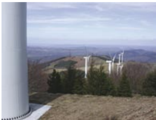
Parc éolien construit en 2002 (Aveyron, France), sur une crête en bordure de hêtraie. A cette époque l'impact des éoliennes sur les chauves-souris n'était guère connu et elles n'étaient pas prises en compte dans l'étude d'impact.

La section suivante fournit des informations sur des évaluations d'impact qui ne sont pas imposées par la loi. Les développeurs devront aussi entreprendre des études en bonne et due forme pour répondre, si nécessaire, aux exigences de l'Évaluation d'Impact Environnemental. Là où il est probable qu'un projet de développement aura des effets environnementaux importants sur les chauves-souris (e.g. effets sur les gîtes, les couloirs de vol, les zones d'alimentation et les migrations saisonnières), une évaluation d'impact environnemental sera requise avant qu'un service instructeur ne puisse décider d'accorder ou non le permis de construire.