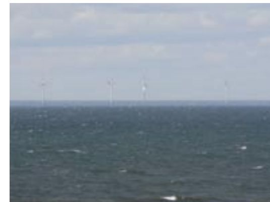
Les parcs éoliens offshore, ici en Suède, peuvent avoir des impacts négatifs sur les chauves-souris quand ils sont placés sur des voies traditionnelles de migration.

à partir du coucher du soleil, en incluant 2 nuits complètes en septembre. Pendant cette période il faudra aussi rechercher les gîtes et territoires d'accouplement. A la fin de septembre et en octobre, sur le continent européen, de nombreuses Nyctalus noctula ont été observées chassant l'après-midi entre 5 et 100 m de hauteur. L'étude devra donc commencer 3-4 heures avant le coucher du soleil, là où ce comportement est suspecté pour Nyctalus noctula .