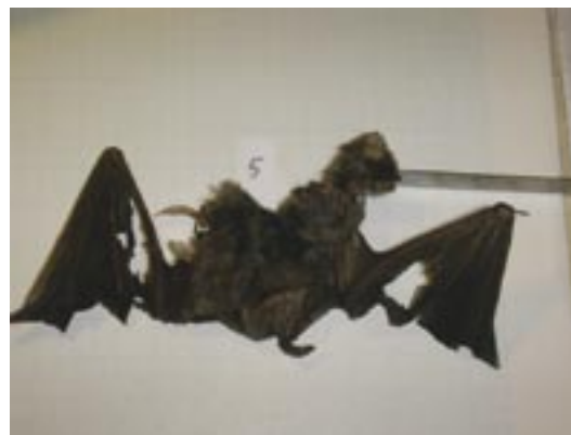
Différentes espèces migratrices de chauves-souris ainsi que des espèces locales sont victimes des éoliennes dans toute l'Europe. Les Noctules communes ( Nyctalus noctula ) sont les espèces les plus affectées par les éoliennes en Allemagne (ici le parc de Puschwitz en Saxe).