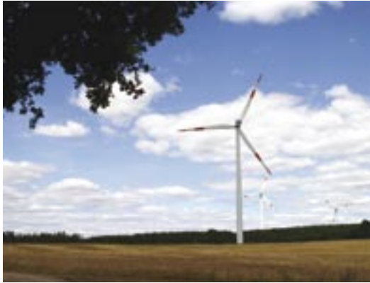
Parc éolien de Puschwitz (Saxe, Allemagne). 10 éoliennes sont érigées dans un paysage de collines présentant des habitats très variés, y compris de nombreux cours d'eau. Entre 2002 et 2006, 76 cadavres de chauves-souris ont été trouvés sous les éoliennes, principalement Noctules communes ( Nyctalus noctula ), Pipistrelles de Nathusius ( Pipistrellus nathusii ), Pipistrelles communes ( Pipistrellus pipistrellus ) et Sérotines bicolores ( Vespertilio murinus ).

permettront de contrôler une bande de respectivement 5 ou 2,5 m de large de part et d'autre du parcours.