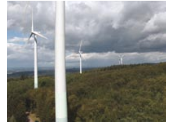
Parc éolien en Forêt Noire, Allemagne. Les populations locales de pipistrelles communes ( Pipistrellus pipistrellus ) ont été affectées par ces éoliennes, ainsi que des espèces migratrices telles que la Noctule de Leisler ( Nyctalus leisleri ).

L'information existante et l'étude du site doivent servir pour déterminer si la présen-