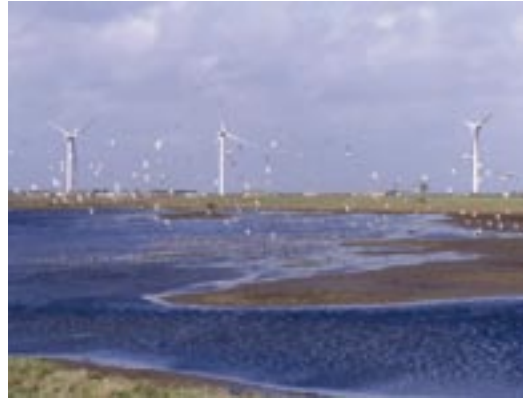
Parc éolien de Bouin (Vendée, France), sur la côte atlantique, où des chauves-souris migratrices sont régulièrement trouvées mortes sous les éoliennes. Les victimes sont principalement des Pipistrelles de Nathusius ( Pipistrellus nathusii ), des Noctules communes ( Nyctalus noctula ) et des Pipistrelles communes ( Pipistrellus pipistrellus ).

Un chien dressé pour marquer l'arrêt sur des chauves-souris peut être utilisé pour rechercher les victimes, mais son efficacité sera testée de la même façon que précédemment. Il faut préférer un chien d'arrêt à un retriever pour que son maître puisse localiser et noter l'endroit exact où la victime est tombée.