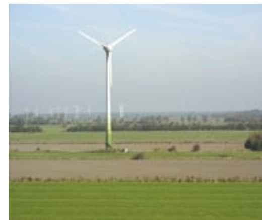
Parc éolien du nord de l'Allemagne. Sérotine (Eptesicus serotinus) et Pipistrelle (Pipistrellus pipistrellus) utilisent régulièrement ce paysage structuré pour chasser. Pour éviter la mortalité, il convient de respecter la distance minimale de 200 m par rapport aux structures paysagères.

b) Année 2, suivi : quelles espèces ne réapparaissent pas pendant la construction (vérifier les impacts que les travaux de construc-