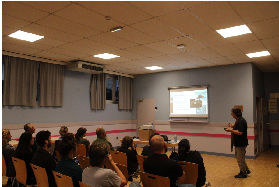
Présentation des chauves-souris en salle